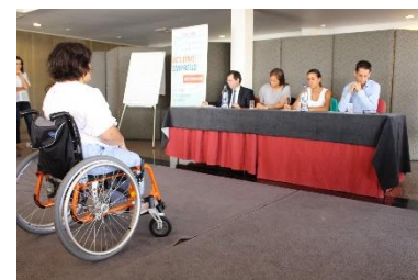
Encontro de Recrutamento