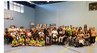
Cerimónia de entrega de apoios Fundação INATEL