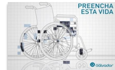
Cândida Fernandes Adaptação de WC

Em 2017, foram apoiadas 27 pessoas, com um valor total de apoios de 93.073,66€, dos quais 86.220,13€ serão comparticipados pela Associação Salvador. Até 31/12/2017 foram incorridas despesas no valor de 17.270,58.