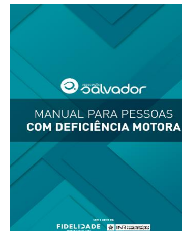
Cerimónia de lançamento do Manual